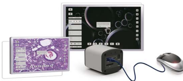
Caméra HDMI Autonome