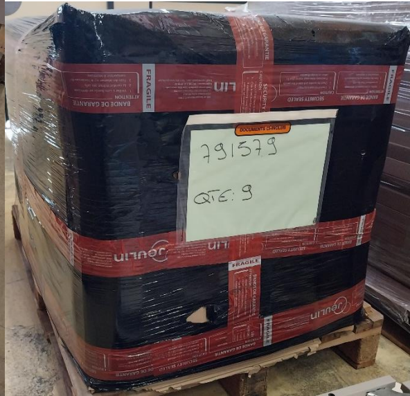
Table espace 120 x 65.