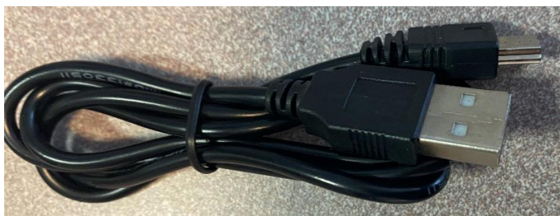
Câble USB pour liaison PC