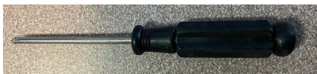
Tournevis pour accès trappe piles