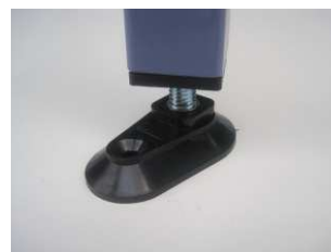
Vérin de mise à niveau