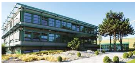
KNF Neuberger GmbH, Allemagne