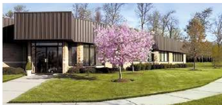
KNF Neuberger, Inc., États-Unis