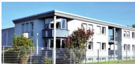
KNF Neuberger SAS, France