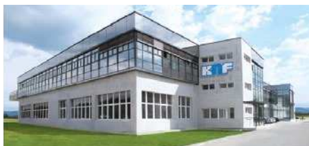
KNF Micro AG, Suisse