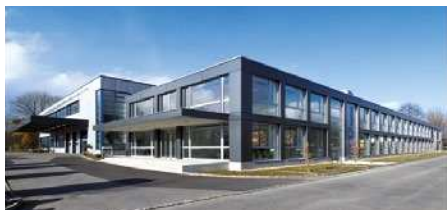
KNF Flodos AG, Suisse