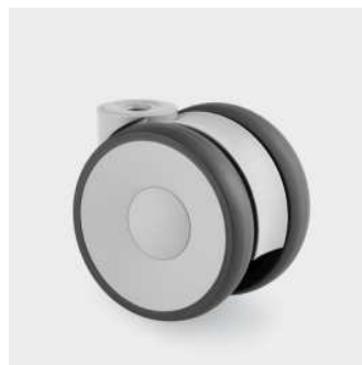
Roulette à frein Ø 75mm