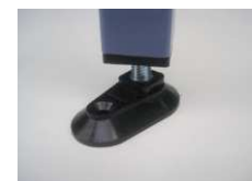
Vérin de mise à niveau