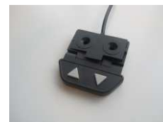
Télécommande RJ45 2 boutons