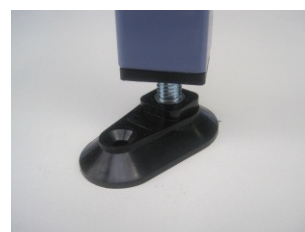
Vérin de mise à niveau