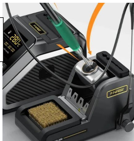
Affichages multimodes avec visualisation de la courbe de température

Socle de mise en veille de la panne détectée, avec mat de passage de câble, support de pannes et brosse de nettoyage