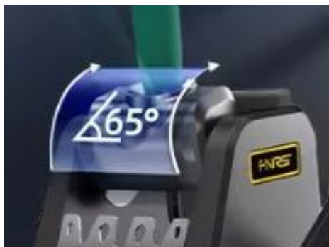
Socle de veille orientable