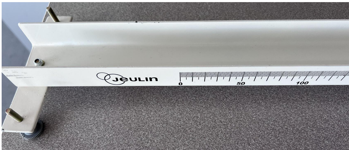
Vue des rayures sur le côté