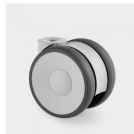
Roulette à frein Ø 75mm