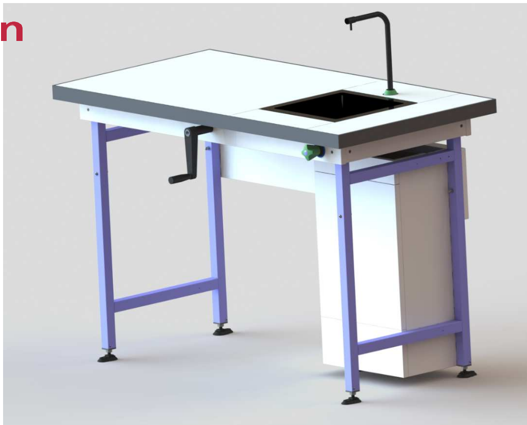
Paillasse adaptée aux Personnes à Mobilité Réduite